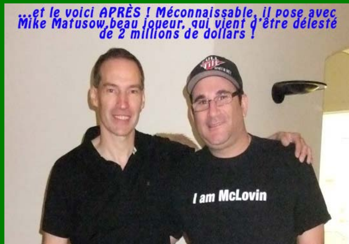
...et le voici APRÈS ! Méconnaissable, il pose avec Mike Matusow, beau joueur, qui vient d'être délesté de 2 millions de dollars !

Toujours au chapitre des paris liés à la nourriture, on peut citer ce pari relevé par Howard Lederer, végétarien notoire et militant, lors d'une partie de cash-game high stakes. Son voisin le met au défi de manger un cheeseburger, et lui parie 10000 dollars. Dans la seconde, Lederer commande un burger, et l'avale en quelques minutes à la table, sous les yeux de l'autre joueur stupéfait.