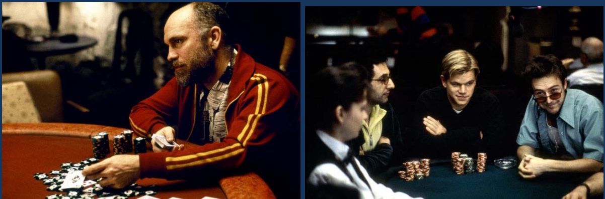
John Malkovick, alias « Teddy KGB », et John Turturro, Matt Damon, et Edward "L'Asdicot" Norton

petits détails qui font l'attachement des vrais joueurs à ce film, par ailleurs plutôt réussi grâce à des acteurs au top.